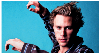
I AM HEATH LEDGER DOCUMENTAL. 90'

DIA 02/03 A LES 19:00H. AL MWC (PL. CATALUNYA)