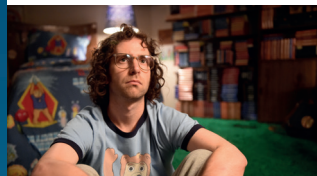
BRIGSBY BEAR COMÈDIA. 97'

Frankie, un adolescent perdut entre l'opressió familiar i un grup d'amics delinqüents, comença a freqüentar homes grans i a tenir-hi relacions sexuals, al mateix temps que coneix Simone i lluita per conciliar els seus desitjos. Hittman guanya la Millor Direcció a Sundance gràcies a un potent estudi de personatges visualment sorprenent.