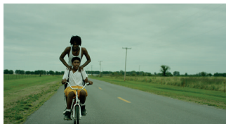
DAYVEON DRAMA. 75'

Direcció: Amman Abbasi Guió: Amman Abbasi, Steven Reneau Intèrprets: Devin Blackmon, Dontrell Bright, Lachion Buckingham