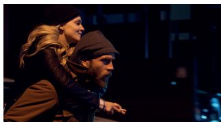
FLESH AND BLOOD DRAMA. 90'

Quan un dels membres d'una companyia d'improvissació de NY salta a la fama, la resta del grup, que són els seus millors amics, comencen a adonar-se que no tots podran seguir-lo. Don't Think Twice ha seduït massivament la crítica que, fins i tot, l'ha comparada amb el Manhattan de Woody Allen. Una petita joia a descobrir.