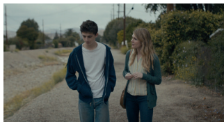
MISS STEVENS COMÈDIA DRAMÀTICA. 86'

DIA 10/03 A LES 21:45H. CINEMES GIRONA (SALA 2)