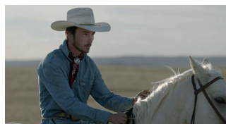
THE RIDER (CLOENDA) DRAMA. 111'

Nominada a la Càmera d'Or a Cannes, entre d'altres molts reconeixements, aquest musical explica, a ritme de rap, com Patricia Dombrowski, aka Patti Cake$ , intenta conquerir el somni de triomfar al món de la música amb la càrrega d'una mare alcohòlica i una àvia malalta.