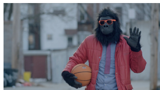
SYLVIO COMÈDIA DRAMÀTICA. 80'

Un adolescent de 14 anys, que lluita amb la seva percepció de la pròpia identitat de gènere i la religió, comença a utilitzar la fantasia per escapar de la seva realitat, i troba la seva passió en el procés. Aclamada a Tribeca, aplega més de dotze premis a festivals LGTB+.