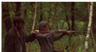
THE STRANGE ONES THRILLER. 82'

Dos germans tornen a la secta de la qual van fugir per descobrir que, potser, aquell grup de creients està menys boig del que ells pensaven. Potser allò en què creuen és la realitat... De Tribeca a Sitges, The Endless no ha parat de fer por als seus espectadors.