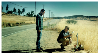
THE ENDLESS CIÈNCIA FICCIÓ. 111'