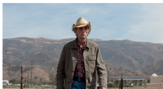
LUCKY DRAMA. 88'

La guanyadora del Millor Guió a Sundance explica la història d'Ingrid, una assetjadora de xarxes socials amb un historial erràtic de "likes". Taylor, influencer de moda, esdevindrà la seva obsessió. Una comèdia fosca i divertidíssima que satiritza el món dels mitjans socials.