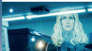
GEMINI THRILLER. 94'

James, un jove brillant, ha crescut veient "Les aventures de l'ós Brigsby", una sèrie de la qual és absolutament fanàtic. El que no sap és que ell n'és l'únic espectador. Quan la sèrie acabi farà tot el possible per fer-la continuar. Sundance, Sitges o Cannes han aclamat aquesta declaració d'amor, en clau d'humor, al poder redemptor de la creativitat.