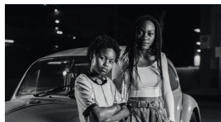
GOOK (INAUGURACIÓ) DRAMA. 94'

Basada en fets reals, l'òpera prima de Mark Webber ens exposa la vida d'un home acabat de sortir de la presó que intenta refer la seva vida a casa. Personatges del film s'interpreten a si mateixos dins d'aquesta història, nominada a SXSW, que navega entre el documental i la ficció.