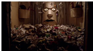
DAVE MADE A MAZE TERROR, COMÈDIA. 80'

DIA 11/03 A LES 18:00H. CINEMES GIRONA (SALA 2)