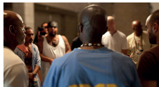
THE WORK 87'

National Geographic posa a l'abast de Brett Morgen material inèdit per reconstruir la intimitat i els entredits de la famosa investigació amb ximpanzés portada a terme per Jane Goodall, una de les dones més influents del segle XX. Des de la seva estrena el 2017, Jane aplega més de 40 premis i nominacions arreu del món.