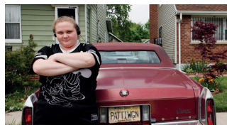
PATTI CAKES DRAMA MUSICAL. 109'

Dins de la comunitat jueva ultraortodoxa de Brooklyn, un vidu batalla per la custòdia del seu fill. Integrament en jiddisch, aquesta òpera prima seleccionada a més de 15 festivals arreu del món explora la naturalesa de la fe i el preu de la paternitat.