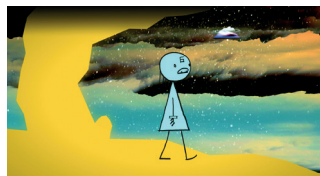
WORLD OF TOMORROW -EPISODES 1 & 2- DRAMA D'ANIMACIÓ. 40'

L'any 1976, amb una eufòria pròpia de l'edat i l'època, una jove parella viatja en autostop cap a la costa est del Canadà. Aquesta aventura plena de rock, rodada en un encertat blanc i negre i celebrada a Toronto, la Berlinale i Gijón, és un coming-of-age senzillament deliciós.