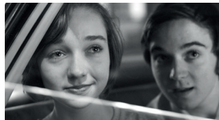
WEIRDOS DRAMA. 85'

Després de patir una lesió al cap i veure la mort molt de prop, un jove cowboy que no pot tornar a muntar, emprèn la recerca de la nova identitat i del que significa ser un home al cor dels Estats Units. Premiada a Cannes, Valladolid, Atenes, Reykjavik, Hamburg o Palm Springs, entre d'altres.