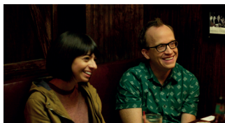
DON'T THINK TWICE COMÈDIA DRAMÀTICA. 95'

Afectat per la mort del seu germà gran, Dayveon, un adolescent de tretze anys, es converteix en el cap d'una banda local mentre passa els seus dies a una ciutat rural d'Arkansas. Amman Abbasi escriu, dirigeix, edita i compon la música de la seva primera pel·lícula que va ser presentada al festival de Sundance.