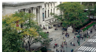
EX LIBRIS 197'