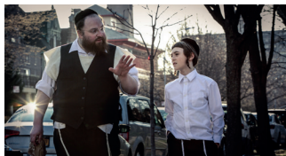
MENASHE DRAMA. 82'

Amb més de deu guardons i quinze nominacions als principals festivals indies del món, ens arriba aquesta petita meravella sobre allò que és realment important. El gran Harry Dean Stanton és Lucky, un vell ateu de 90 anys que conviu amb la seva aparent intranscència quotidiana.