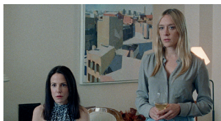
GOLDEN EXITS* DRAMA. 94'